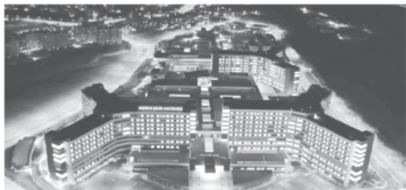
Mersin Şehir Hastanesi

2- "Hizmet standartlarında ve personel sayısında düşüşe yol açmaktadır." (ay., s. 2) Raporda daha sonra şöyle deniyor: